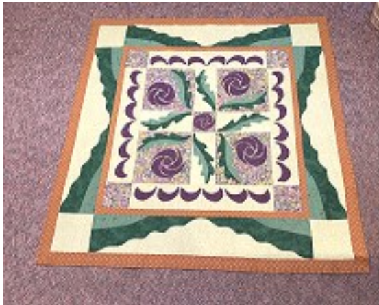
Morados y verdes con ribete marrón

Boletos de rifa disponibles en la Oficina de la Escuela.