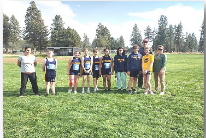
Equipo X-Country 2022-Go Saints!