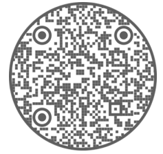
Un poco de amor de Escuela San Francisco.

Nuestra visión es inspirar a académicos, motivados servir con fe y carácter moral.